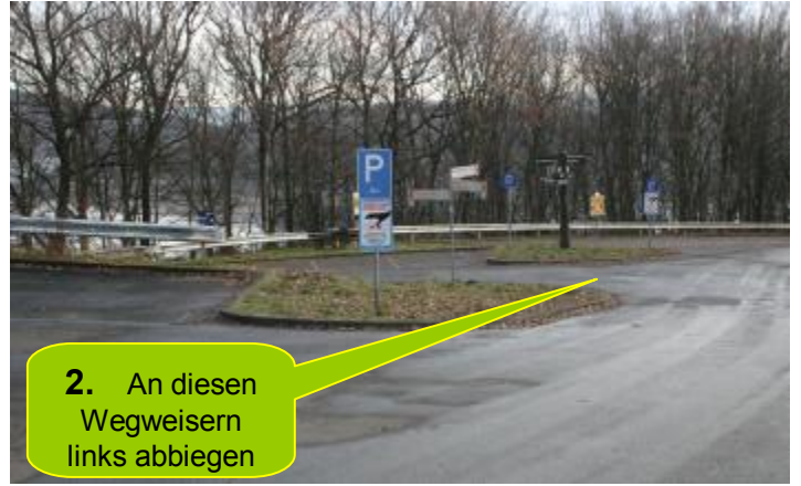
2. An diesen Wegweisern links abbiegen